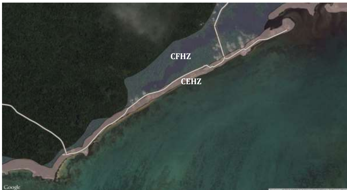
Ata 0.4 Foliga vaaia o le TDA 2 Upolu i Saute - Saanapu

Ata 0.4 ma le Ata 0.5 o loo faaalua ai le CEHZ ma le CFHZ e tusa ai ma le afioaga o Sataoa ma Sa'anapu.