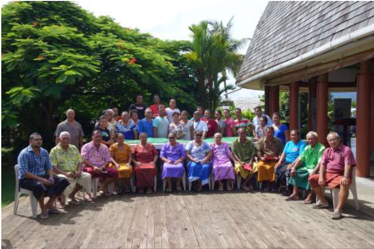
Ata 0.3 Sui auai ma le ata faata'ita'i i le P3D

Fuafuaga mo le Puleaina Lelei o le TDA 2 mo Upolu I Saute