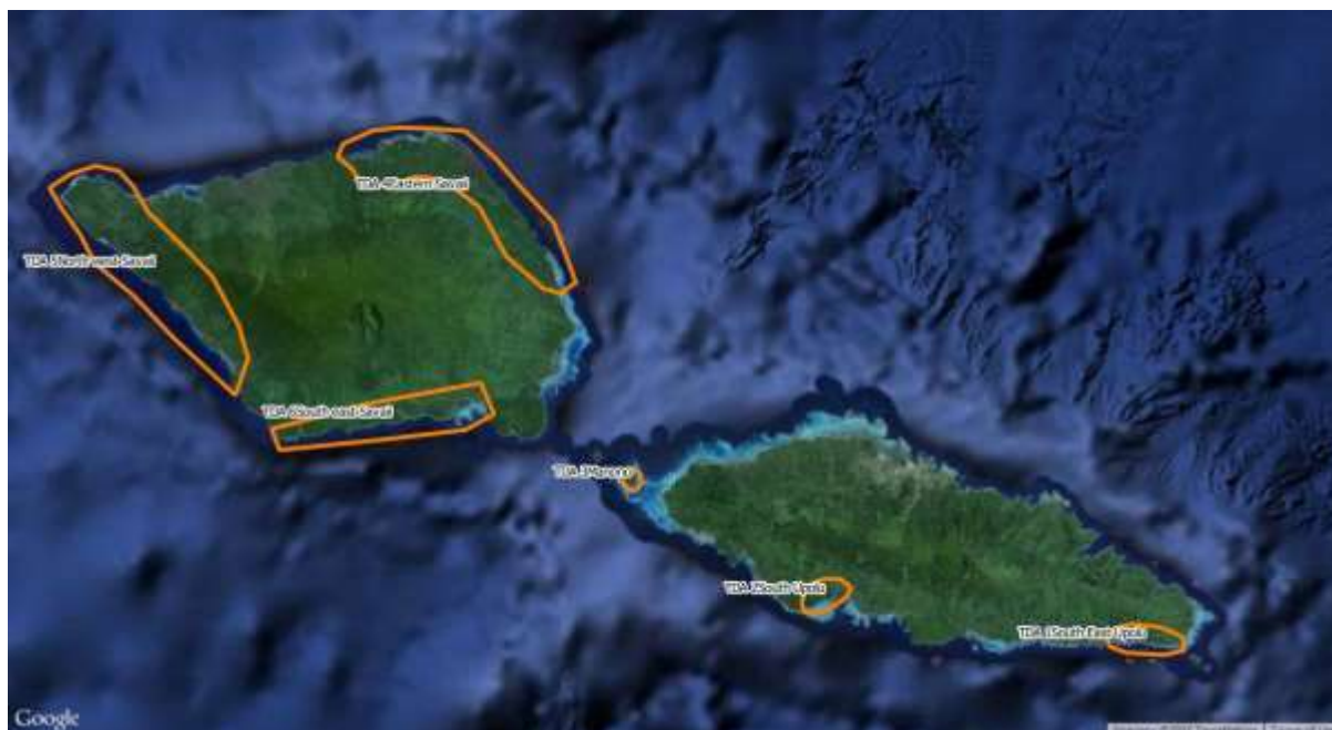
Ata 0.1 Nofoga o loo iai le TDA 2 Saute o Upolu

O le TDA 2 e aofia ai afioaga o le itumalo o Safata o Sataoa ma Sa'anapu lea o loo ile ogatotonu o le gataifale i sasa'e o le motu o Upolu (vaai i le Error! Reference source not found. ). O loo iai nei nuu i totonu o le Itumalo o Safata lea e tele lona talaaga i tu ma aga faaleaganuu e pei ona faaalua e ala i meataulima, le agaga talimalo o tagata, iloa o le tāua o 'oa faanatura a le Itumalo ma le olaga maopoopo ma le felagolagoma'i o tagata o loo nonofo ai.